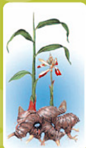
Racine de gingembre

Basées sur l'utilisation des énergies et des ressources naturelles, les médecines traditionnelles asiatiques font un retour remarqué dans le monde occidental.