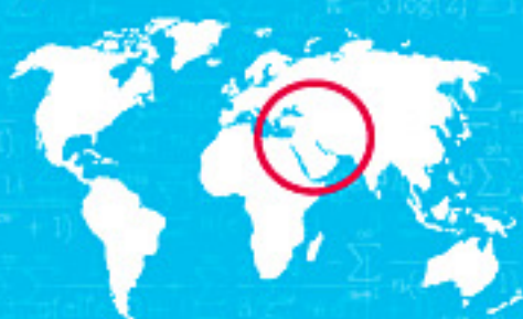
7 CARACTÈRES EN CHIFFRES ARABES